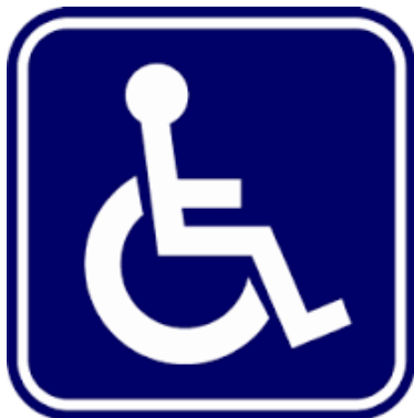
สัญลักษณ์ผู้พิการ